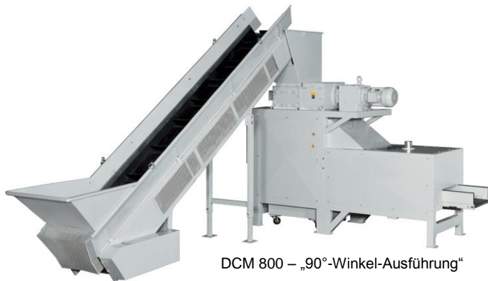
DCM 800 – „90°-Winkel-Ausführung“