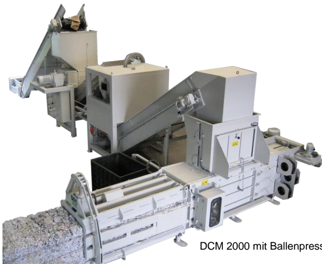
DCM 2000 mit Ballenpresse